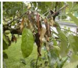
Alle Austriebe am befallenen Ästchen welken.