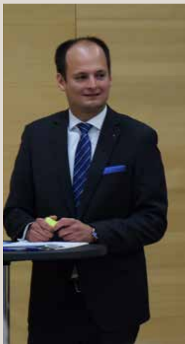
Bürgermeister Egmont Schwärzler