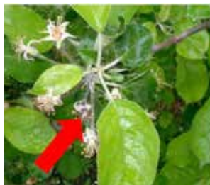
Blütenbüschel mit einer Blüte, die einen braunen Blütenstiel hat und nicht abfällt.

Daher ist es wichtig, Befälle zu melden und fachgerecht zu versorgen. Feuerbrand ist meldepflichtig. Jede Gemeinde hat einen Feuerbrand-Beauftragten, der die Meldung bearbeitet und Ratschläge zur Versorgung befallener Pflanzen gibt. Gerade bei Birne und Quitte ist eine rasche Bekämpfung wichtig, damit die Bakterien nicht in den Baum eindringen, wo sie viele Jahre nachweisbar und infektiös sind. Robuste Apfelsorten sind meist in der Lage, den Feuerbrand selbst abzustoppen und von selbst nach einigen Jahren wieder bakterienfrei zu sein.