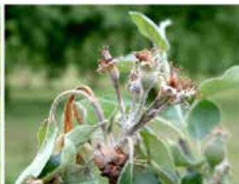
Austriebe in der Nähe des befallenen Blütenbüschels welken.